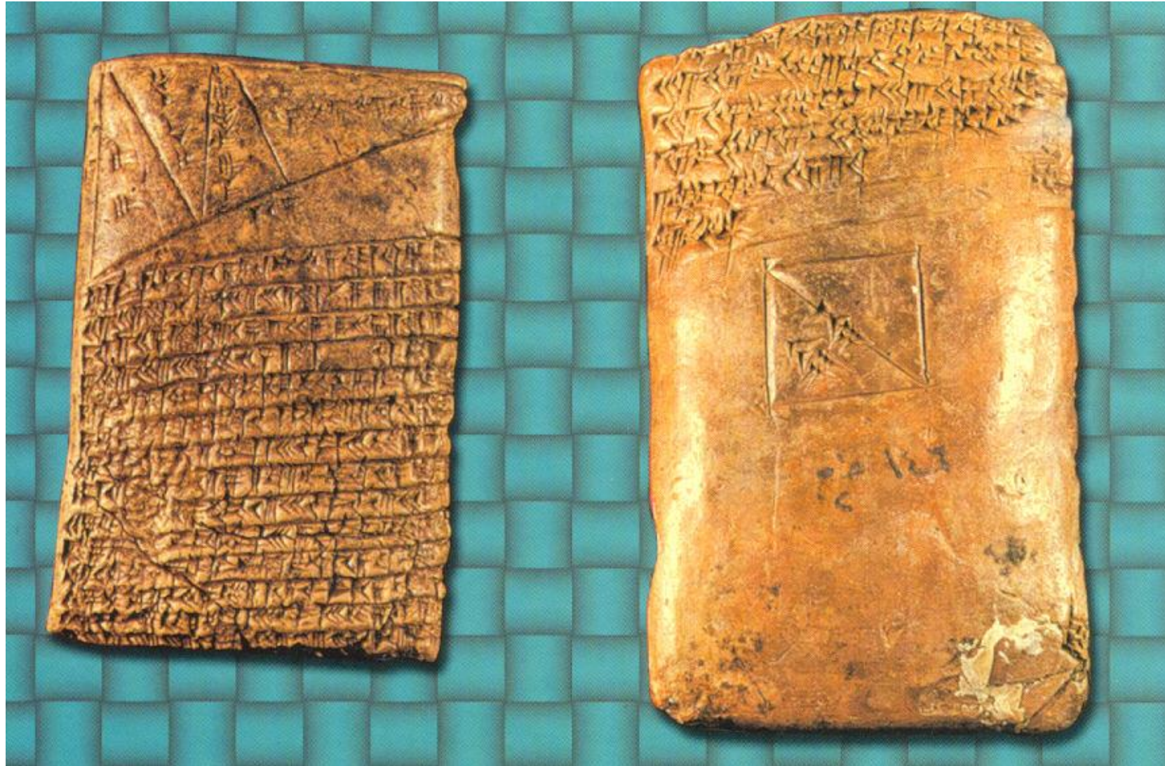
Tablette sumérienne (1800 Av. J-C) provenant de Tell Harmal, Iraq.